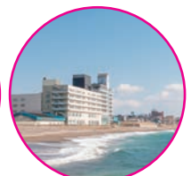
イマジ ンホテル&リゾート函館