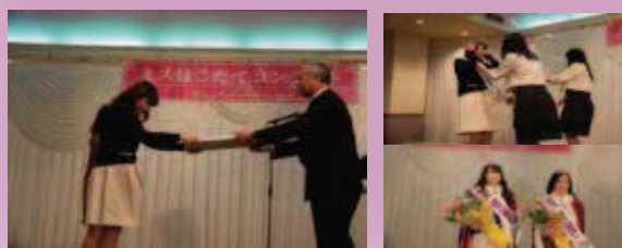
第34代ミスはこだて認定書授与(昨年度)