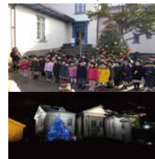
写真下:設置場所元町公園内