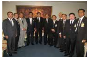
タイ観光客誘致訪問団

現地では、工藤壽樹函館市長を団長に、総勢17名による、タイ国政府や各関係機関への訪問の他、現地航空会社や旅行会社各社に対する観光客送客の要請活動、インセンティブ旅行（報酬旅行）を視野に入れた日系企業への観光プレゼンテーションの実施など、当地の魅力をPRして参りました。