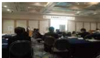
プレゼンテーション風景

10月23日、東京にて行われました、北海道観光振興機構主催による、「北海道観光プロモーション」に参加いたしました。本プロモーションでは、北海道内の各市町や観光協会、民間企業が参加し、オール北海道にて首都圏の旅行会社20社を対象とした観光プレゼンテーション及び観光商談会、ランチミーティングを行いました。当協会も平成26年度上期の観光素材を中心に見どころの紹介を行い、北海道新幹線開業による新たな商品造成依頼をして参りました。