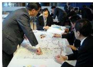
DIG (図上での災害訓練) 風景