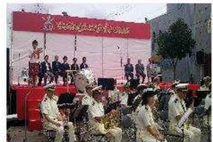
大門グリーンプラザ会場：オープニング

9月7日・8日に、函館最大の食のイベント「はこだてグルメサーカス 2013」が開催されました。大門グリーンプラザ・朝市第一駐車場の2会場で122店舗が出店した今年は、昨年を上回る延べ17万1千人が来場し、両日ともに売り切れの店舗が続出するなど、大変な賑わいを見せました。当協会も実行委員会に参画し、観光パンフレット等の配布により、観光PRに努めました。