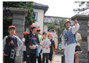
「フィールドワーク」風景