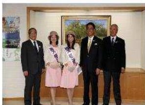
市長を囲んでの記念撮影

10月1日、函館物産協会様より寄贈された秋物制服披露式を執り行いました。新たな制服を着用したミスはこだてからは、「制服が一新し、心機一転がんばりたい。」と今後の全国観光物産展等活動に向けての抱負が語られました。