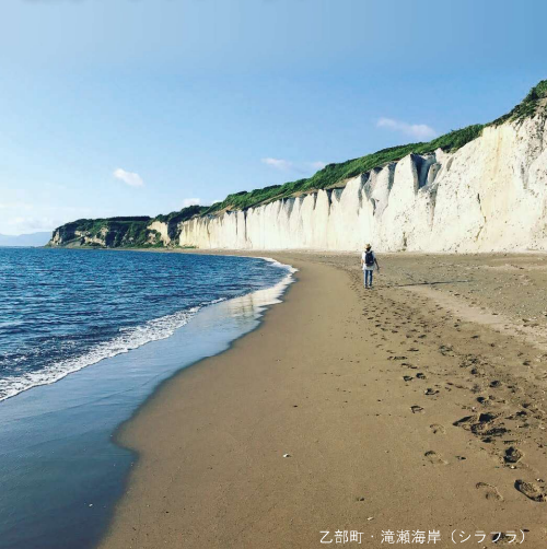
乙部町・瀧瀬海岸(シラフサ)