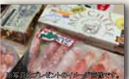
※写真はプレゼントのイメージ画像です。

https://hakodate-kankou.com/specialticket/